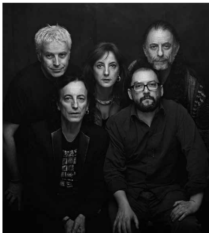
Companyia Elèctrica Dharma 40 anys 9 d'abril