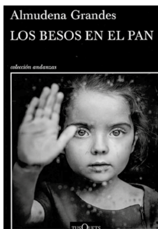
_GRANDES, Almudena Los besos en el pan