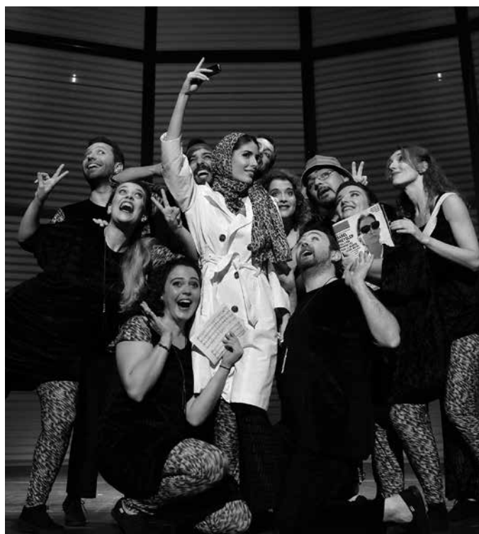
Cor de Teatre Allegretto 7 de febrer

Aquestes festes, regala emocions! Regala cultura per al 2016!