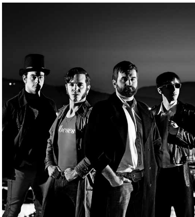
Obeses 23 d'abril