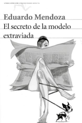
_MENDOZA, Eduardo El secreto de la modelo extraviada