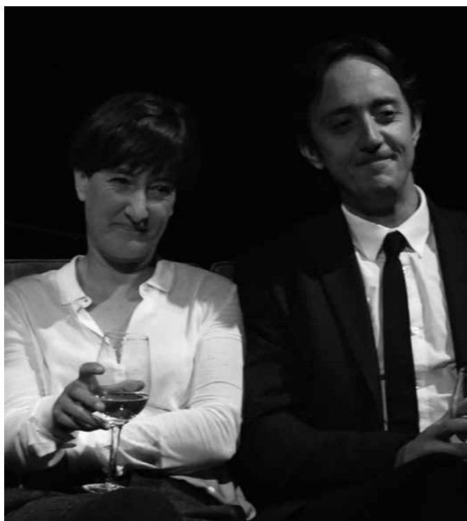
Marits i mullers Text de Woody Allen 4 de març