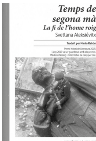
_ALEKSIÉVITX, Svetlana Temps de segona mà: la fi de l'home roig