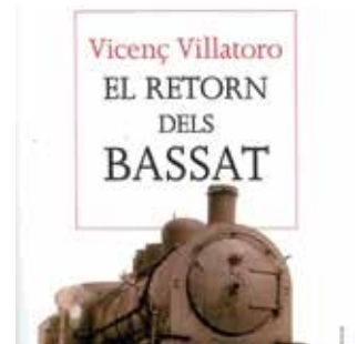
VILLATORO, Vicenç El retorn dels Bassat