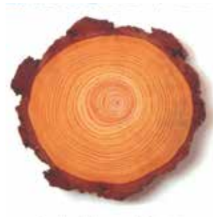
FUSTER, Valentí i CORBELLA, Josep La ciència de la llarga vida