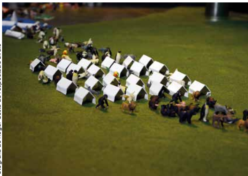
de l'espectacle Birdie

Podeu consultar i descarregar l'agenda al web www.olotcultura.cat o bé recollir-ne un exemplar als equipaments culturals de la ciutat.