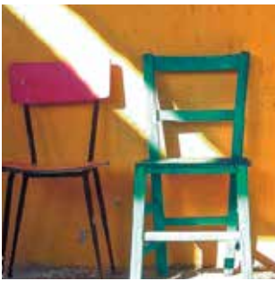
CAMILLERI, Andrea Mort mar endins