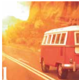
MIRA, Rodrigo El clàssic del sud