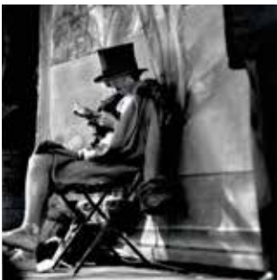
KERTÉSZ, André Leer