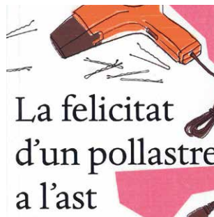
SOLDADO, Marta F. La felicitat d'un pollastre a l'ast

Consulta totes les novetats al web de la Biblioteca