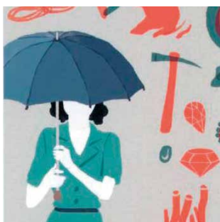
AGUALUSA, José Eduardo Teoria general de l'oblit