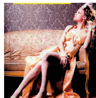
MARTÍN, Andreu L'Harem del Tibidabo