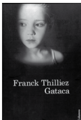
_THILLIEZ, Franck. Gataca