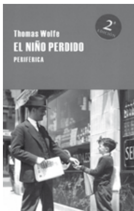
_WOLFE, Thomas. El niño perdido