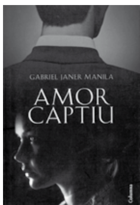
_JANER MANILA, Gabriel. Amor captiu