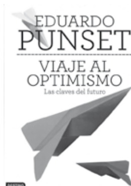
_PUNSET, Eduardo. Viaje al optimismo