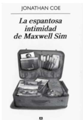
_COE, Jonathan. La espantosa intimidad de Maxwell Sim