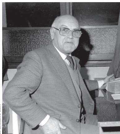
LA COMARCA L'OLOT

De jove em plaïa anar a ballar sardanes, de fet era una de les poques distraccions que en aquells anys seixanta hi havia a Olot: sardanes cada setmana, al Firal i al Parc Vell. Jo hi assistia assíduament i, com que sabia comptar i repartir, els companys m'esperaven sempre per formar les rotllanes.