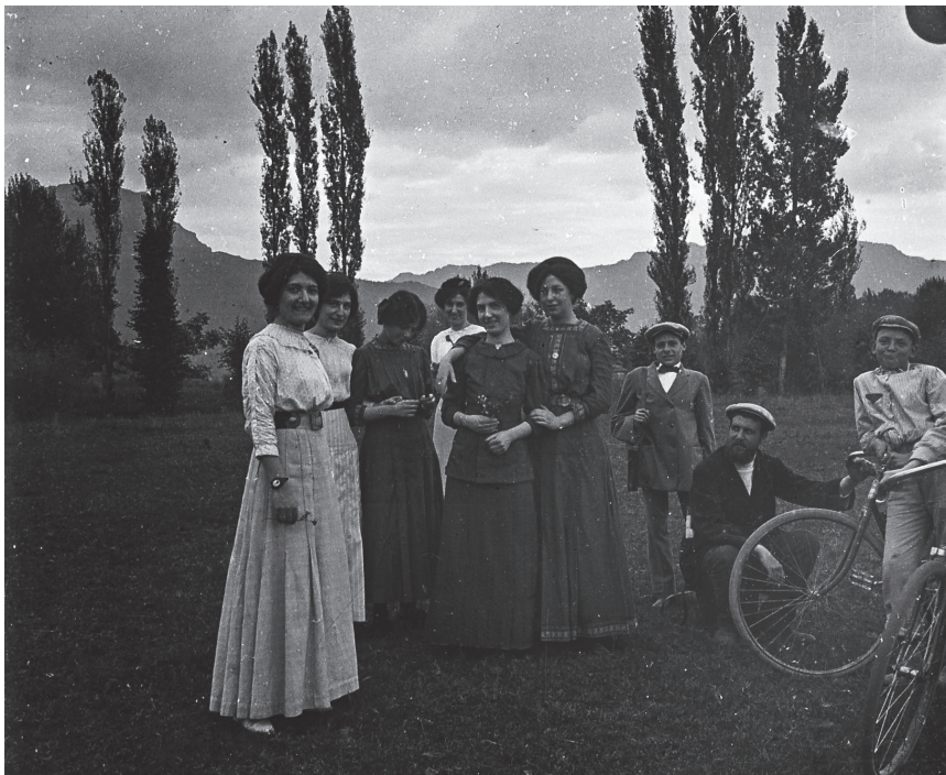
Olot, 15 de gener de 1918