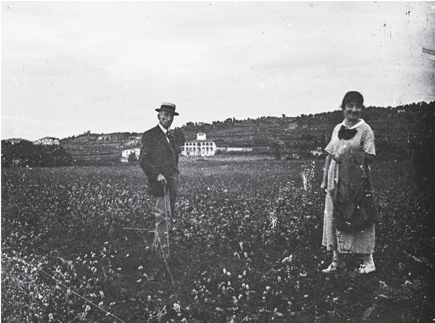
Olot, 10 de març de 1918