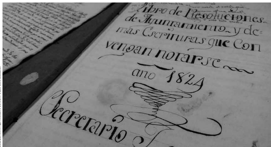
ACGAX. Fons Ajuntament de Sant Feliu de Pallerols

El passat 26 de novembre de 2019, l'Ajuntament de la Vall d'en Bas va acordar la cessió en règim de comodat de part del seu fons documental a l'Arxiu Comarcal de la Garrotxa (ACGAX). Amb aquest ingrés, que es concretarà al llarg de l'any 2020, ja són dotze els municipis garrotxins que, des de l'entrada en funcionament de les noves instal·lacions de l'ACGAX, ubicades al puig del Roser, d'Olot, l'any 2012, han decidit cedir-li la seva documentació històrica. En tots els casos, la fórmula jurídica per a l'ingrés ha estat el contracte de comodat entre l'Ajuntament, el Consell Comarcal de la Garrotxa i el Departament de Cultura de la Generalitat, que suposa la cessió gratuïta de la documentació, tot mantenint-ne la titularitat.