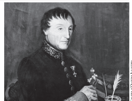
GALERIA D'OTOLINS IL·LUSTRES

Mort el 1844, l'Acadèmia de Ciències Naturals i Arts de Barcelona va incloure el seu retrat a la galeria de científics il·lustres de l'entitat (1846). A la ciutat natal, va ser nomenat Fill Il·lustre i inclòs a la Galeria d'Olotins Il·lustres (1962).