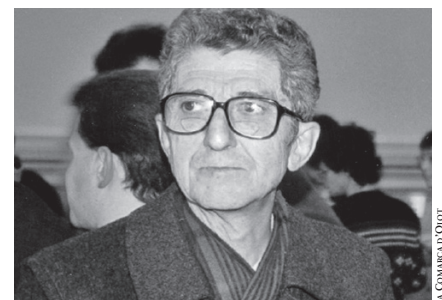
LA COMARCA D'OTOT

Entre les nombroses publicacions de Llongarriu, cal destacar els llibres La meua Garrotxa. Un antic i oblidat país (1990) –una selecció d'articles apareguts a la revista L'Olotí – i Un any a pagès. La comarca d'Olot: una agricultura cerealista i de subsistència (1995), on va detallar la vida agrícola local abans de la mecanització del camp. Va morir a la seva ciutat natal el 2006.