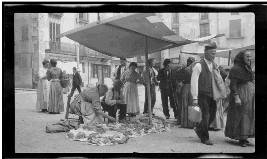
ARXIU D'ETNOGRAFIA I FOLKLORE DE CATALUNYA, CSIC

L'Arxiu d'Etnografia i Folklore de Catalunya ( https://www.imf.csic.es/project/arxiu-detnografia-i-folklore-de-catalunya/ ) és a l'abast dels investigadors al web Simurg, la pàgina que alberga els fons digitalitzats de les biblioteques i els arxius del Centre Superior d'Investigacions Científiques (CSIC). Aquest projecte centrat en la recerca, la recollida i la sistematització de la cultura tradicional catalana, iniciat per Tomàs Carreras i Artau, és un recull documental d'una gran diversitat d'elements. El filòsof i advocat Tomàs Carreras i Artau (1879-1954), catedràtic d'Ètica a la Universitat de Barcelona, el va idear com una gran base de dades sobre l'etnografia i el folklore de Catalunya adscrita a la seva càtedra i es va anar conformant durant més de 50 anys, de 1915 a 1968. Els materials aplegats es conservaven inicialment a la seu universitària fins a la incorporació al CSIC l'any 1945, la institució científica que en va reprendre l'activitat fins a la cancel·lació definitiva del projecte. Amb l'agrupació de tots els centres d'humanitats barcelonins del CSIC en una sola entitat, l'any 1968, la Institució Milà i Fontanals d'Investigació en Humanitats (IMF) es va fer càrrec de la gestió i la divulgació d'aquell ric patrimoni documental etnogràfic.