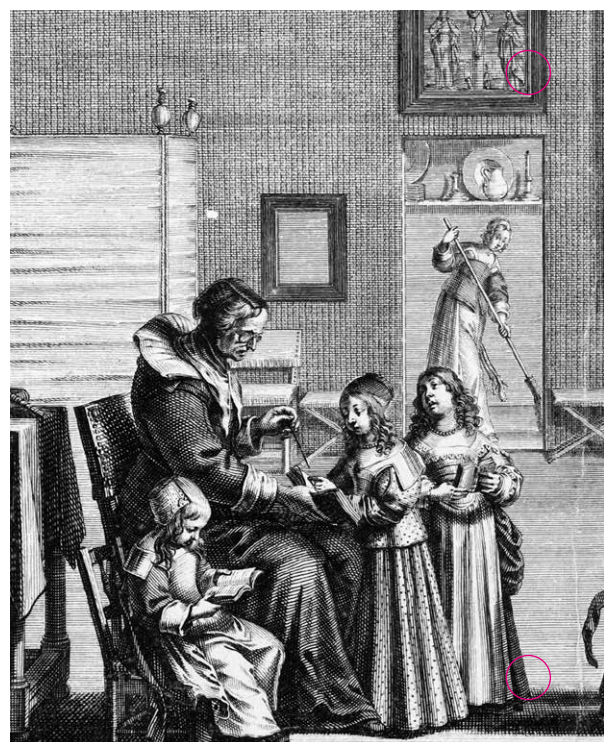
The MET. La maïstrasse d'escole, c.1638

Era la primera passa en l'educació de les olotines, restringida a llegir, escriure, cosir i brodar, a més de rebre instrucció religiosa. A la mort de la pionera, deu anys després, l'escola va desaparèixer i el municipi no va recuperar l'alfabetització pública femenina fins a les acaballes d'aquell segle.